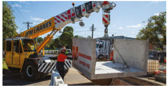
電纜接駁井建築 (Hillcrest Avenue, Greenacre)

電纜徑路西部多處工段溝槽挖掘以及埋管施工已經完成，我們計劃從11月初開始穿管拉線。