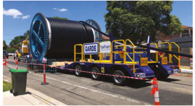
Lắp đặt và kéo cáp vào ống dẫn tại Maiden Street, Greenacre

Chúng tôi cam kết hợp tác với quý vị để giảm thiểu tác động của dự án. Ý kiến đóng góp chúng tôi nhận được cho đến nay đã giúp chúng tôi cải thiện cách chúng tôi làm việc trong cộng đồng. Chúng tôi xin cảm ơn tất cả những người đã liên lạc với chúng tôi cho đến nay.