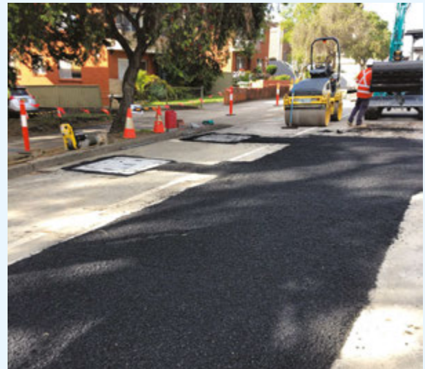
Khôi phục đường lộ tạm thời, Yangoora Road, Lakemba