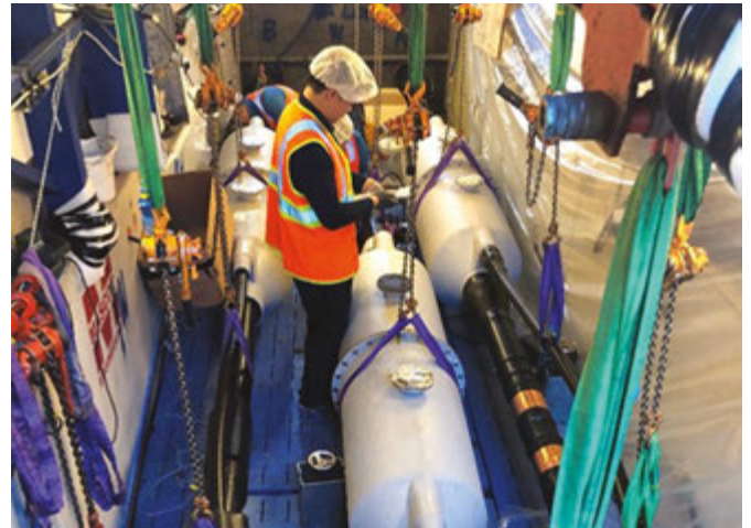
Nối kết và thử các đoạn cáp và bên trong hầm kết nối tại Rawson Road, Greenacre