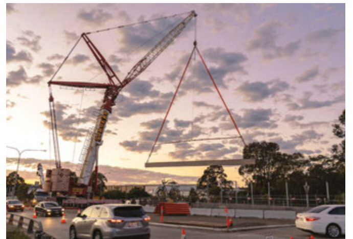
Muir Road অক্টোবরের লং উইকেন্ডে ক্যাবল ব্রিজের কাজ শুরু হবে।