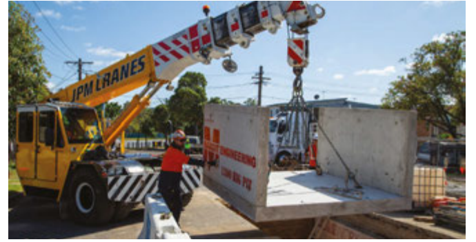
Hillcrest Avenue, Greenacre এ জয়েন্ট বে অথবা সংযোগ স্থল স্থাপন