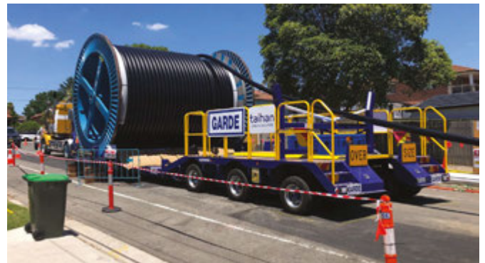
电缆输送和拉线 (Maiden Street, Greenacre)

我们致力与您合作,将施工期间造成的影响降至最低。工程开始至今,来自社区各界的反馈让我们极大地改善了工作方式,特此感谢每一位向我们提出建议的社区居民。